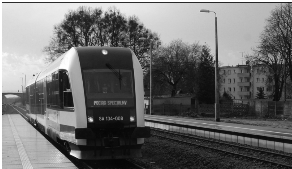
9 grudnia o godz. 11:20 tzw. „pociąg specjalny” wjechał na peron dworca PKP Murowana Goślina.

Uroczysty przejazd rozpoczął się o godz. 10:50 z dworca letniego w Poznaniu. Każdy podróżny otrzymał przed startem pamiątkowy bilet.