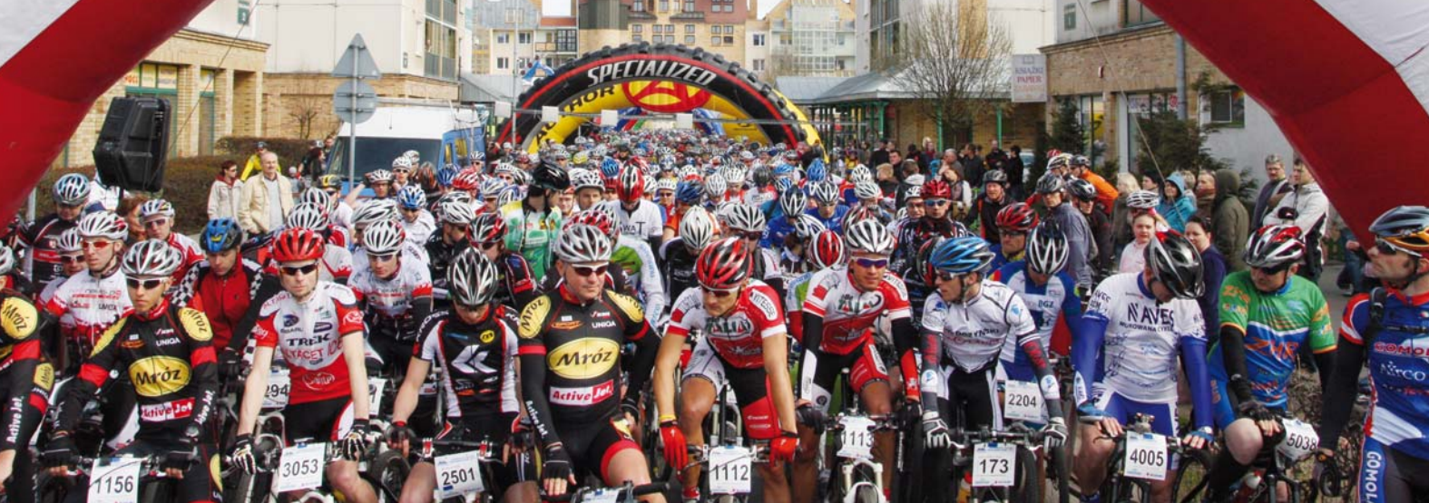
Zawodnicy VI Powerade Suzuki MTB Marathon - start trasy MEGA.