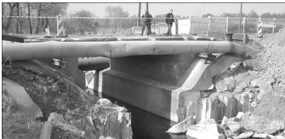
Most na Trojanca.