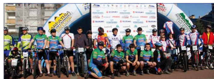
Goślinianie startujący w VI Powerade Suzuki MTB Marathonie.