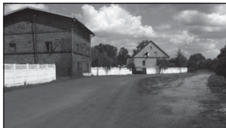
Ulica Raduszyńska w Murowanej Goślinie.

Odcinek drogi objęty projektem rozpoczyna się 80 m przed skrzyżowaniem z dojazdem do przepompowni ścieków, prowadzi przez istniejący mostek na rzece „Trojanka” i kończy się na skrzyżowaniu z ul. Mściszewską. Na odcinku od przepompowni ścieków do istniejącego mostku droga ma nawierzchnię asfaltową. Od mostku do skrzyżowania z ul. Mściszewską nawierzchnia drogi jest gruntowa z zawartością żużla o nieregularnej szerokości. Istniejąca szerokość drogi o nawierzchni asfaltowej wynosi 6 m. Ulica Raduszyńska nie posiada chodników.