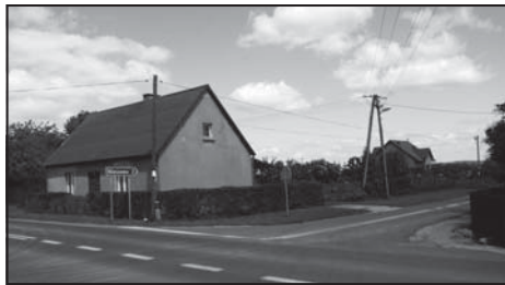
Skrzyżowanie drogi nr 187 z drogą powiatową w Białężynie.

Całkowity koszt projektu to 486.647 zł, zaś planowane dofinansowanie z działania Odnowa i rozwój wsi w ramach PROW to 199.440 zł.