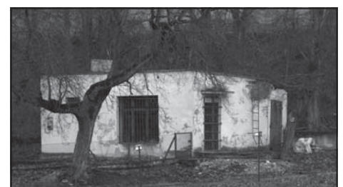
Świetlica wiejska w Głębozczku.

Całkowity koszt projektu to 352.182 zł, zaś planowane dofinansowanie z działania Odnowa i rozwój wsi w ramach PROW to 144.337 zł.