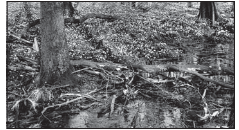
Rezerwat Śnieżycowy Jar.

promocyjnych. Oznakowanie szlaku wykonane zostanie jesienią tego roku.