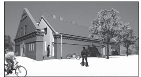
Świetlica wiejska w Rakowni.

10. Rozstrzygnięto również przetarg ogłoszony przez Stowarzyszenie Przyjaciół Rakowni na realizację projektu Budowa i wyposażenie świetlicy wiejskiej w Rakowni . Prace potrwać do końca przyszłego roku.