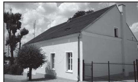
Budynek przy ulicy Kochanowskiego.

Zgodnie z umową na wieloletnie zarządzanie i realizację inwestycji w komunalnym zasobie lokalowym gminy Murowana Goślina wykonawca tj. LIDER Spółka z o.o. z siedzibą przy ulicy Grunwaldzkiej w Poznaniu jest zobowiązany do przeprowadzenia kompleksowych remontów wskazanych budynków komunalnych. Pierwszy remont dotyczył budynku Ośrodka Zdrowia. Następny w kolejności był budynek mieszkalny przy ulicy Kochanowskiego 18. Prace rozpoczęły się jeszcze w 2009 roku. W ich wyniku obiekt uzyskał nowy wygląd. Ocieplono ściany, zmieniono elewację, wymieniono okna, wyremontowano klatkę schodową itp. Dodatkowo przygotowano do zasiedlenia lokal na piętrze (który do tej pory był pustostanem).