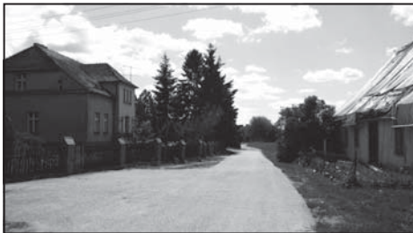
Droga przy kościele w Długiej Goślinie.

Celem projektu jest poprawa standardu życia na terenie 5 wsi w gminie poprzez instalację 19 lamp oświetlenia ulicznego. LAMPY zostaną zainstalowane w najważniejszych miejscach w miejscowościach - przy głównych ciągach komunikacyjnych, prowadzących do sklepów, kościołów, przedszkoli, świetlic wiejskich, zakładów pracy, a także miejsc wypoczynku i rekreacji. Realizacja projektu zwiększy zatem bezpieczeństwo w miejscach publicznych, poprawi warunki życia, zwiększy atrakcyjność turystyczną miejscowości.