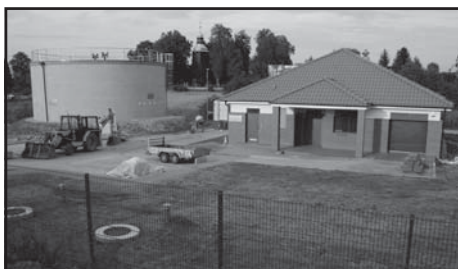
Stacja uzdatniania wody w Długiej Goślinie.

W wyniku rozbudowy i modernizacji ujęcia wody i stacji uzdatniania wody w Długiej Goślinie wybudowane zostały dwa nowe obiekty budowlane o bardzo ciekawej architekturze. W ich wnętrzach działa bezobsługowa stacja uzdatniania wody wraz z dwukomorowym zbiornikiem wody pitnej. Znamionowa wydajność godzinowa urządzeń w linii uzdatniania wynosi 70 m 3 /h, a maksymalna ilość wody podawanej do sieci wodociągowej wynosi 112 m 3 /h. Pojemność każdej komory zbiornika retencyjnego wynosi po 365 m 3 . Woda do stacji uzdatniania podawana jest z dwóch zmodernizowanych studni, w których zamontowano nowe pompy głębi-