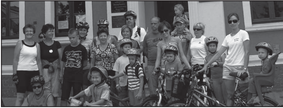
Uczestnicy rajdu rowerowego.