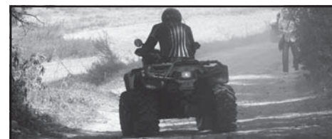
Rajd „Murowana Trophy 2010”.