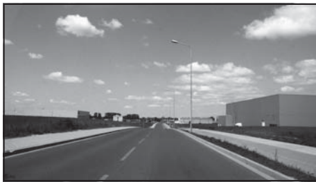
Ulica Polna w Murowanej Goślinie.

7. Trwa ostateczne rozliczanie Modernizacja drogi gminnej w ciągu ulicy Polnej w Murowanej Goślinie . W lipcu br. odbyła się kontrola w miejscu realizacji inwestycji, zaś w sierpniu br. został złożony wniosek o płatność końcową. Ostateczna kwota dotacji w wysokości 2.635.201,40 zł powinna zostać wypłacona w październiku br.