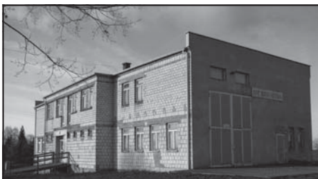
Świetlica wiejska (remiza OSP) w Boduszewie.

Poprawa infrastruktury kultury w miejscowości, zapewnienie warunków do spędzania wolnego czasu, organizacja miejsc noclegowych dla gości. Realizacja projektu pozwoli na pełne wykorzystanie budynku OSP – będzie on nie tylko w większym stopniu pełnił funkcję ośrodka kultury i sportu dla mieszkańców Boduszewa, ale stanie się gminnym Centrum konferencyjno-szkoleniowym, co z pewnością podniesie atrakcyjność miejscowości w gminie i poza nią.