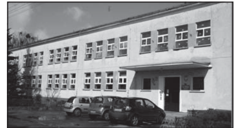
Szkoła Podstawa nr 1 im. Karola Marcinkowskiego w Murowanej Goślinie.

szkolnych dzięki zmniejszeniu strat ciepła przez przegrody budowlane.