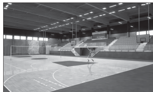
Wizualizacja wnętrza hali sportowej

siatkówki głównej i 3 do siatkówki treningowej, do piłki ręcznej i hokeja halowego) wraz z trybunami dla 485 widzów. Arena boiska umożliwia rozgrywki sportowe na poziomie międzynarodowym w piłce ręcznej, koszykowej, siatkowej i hokeju halowym (wysokość hali w świetle nad areną - 9 metrów) oraz sport szkolny w ramach zajęć. Hala posiada odrębne wejście i może pełnić funkcje widowiskowe i rekreacyjne w sposób samodzielny. Przy wejściu głównym zaprojektowano szyb windy.