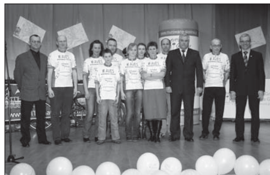
Nowo powstały team Aves Murowana Cykloza.

Po części oficjalnej przy poczęstunku była okazja do nawiązania kontaktów pomiędzy rowerzystami i samorządowcami. Jak na pasjonatów dwóch kółek przystało, rozmowy toczyły się przede wszystkim na tematy rowerowe. Wystrój auli tego dnia przypominał start maratonu, a więc były dmuchane bramy, płotki i banery promujące Murowaną Goślinę.