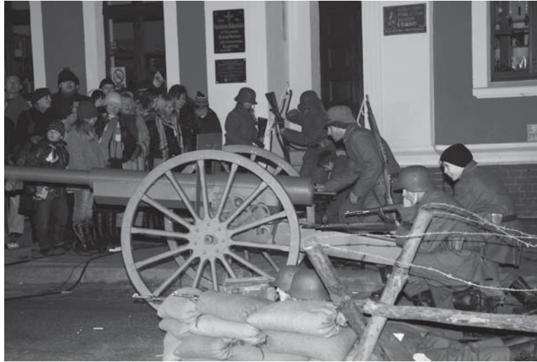
Obchody 90. rocznicy Powstania Wielkopolskiego w Murowanej Goślinie

tablicy: Kurkowego Bractwa Strzeleckiego oraz Cechu Rzemieślników, Kupców i Przedsiębiorców. Potomkowie zajęli honorowe miejsce na scenie, by razem z pozostałymi widzami uczestniczyć w widowisku plenero-