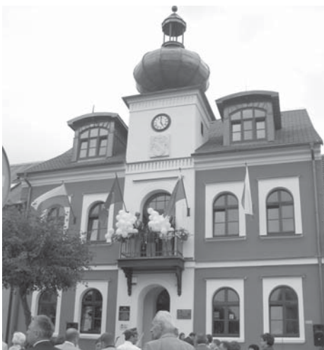
Ratusz w zabytkowej części miasta.