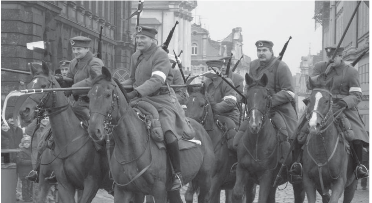
Inscenizacja Powstanie Wielkopolskiego przygotowana przez Grupę Rekonstrukcji Historycznej „3 Bastion Grolman” (28 grudnia 2007).