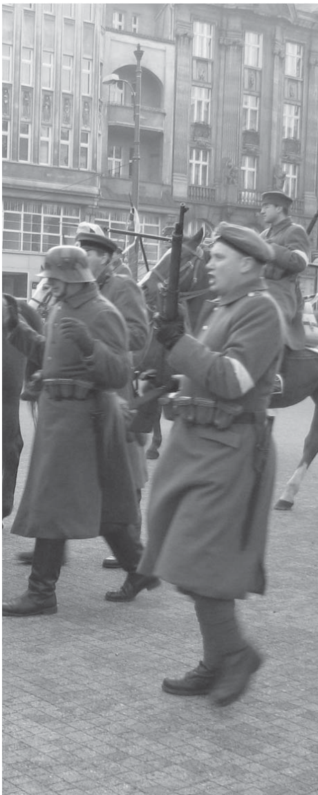
Koniec powstania - eskorta pokonanych Niemców.