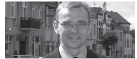
Tomasz Łęcki - Burmistrz Miasta i Gminy

W tej kategorii znalazły się m. in.: ul. Raduszyńska, plac Powstańców Wielkopolskich, Pałac wraz z parkiem, budowa i modernizacja boisk przy szkołach czy budowa inkubatora przedsiębiorczości. W przypadku tych inwestycji ich zakres jest uzależniony od wysokości pozyskanych dotacji zewnętrznych, głównie z Unii Europejskiej.