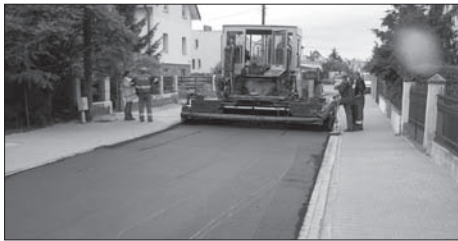
Budowa ulicy Bukowej.

Całkowity koszt inwestycji wyniósł 423 205 zł.