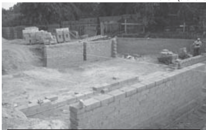
Fundamenty budynku komunalnego przy ul. Kochanowskiego 16