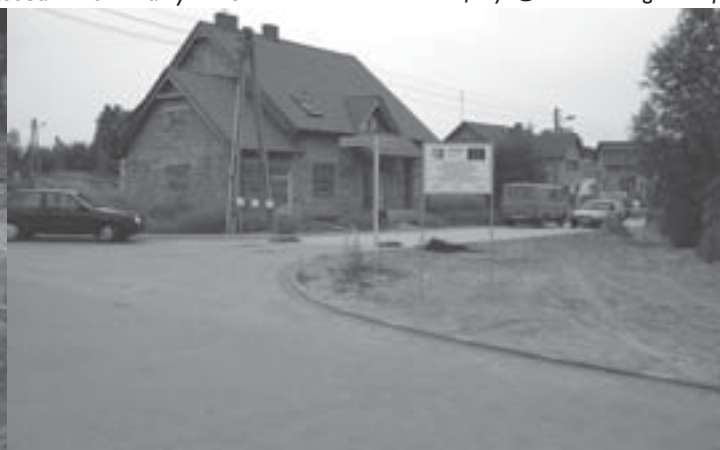
Tablica informacyjna ZPORR na skrzyżowaniu ul. Śliwkowej i Morelowej