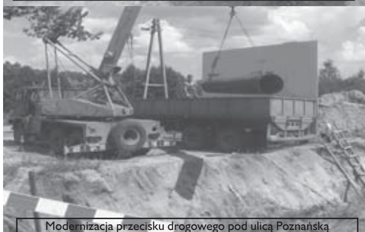
Modernizacja przecisku drogowego pod ulicą Poznańską