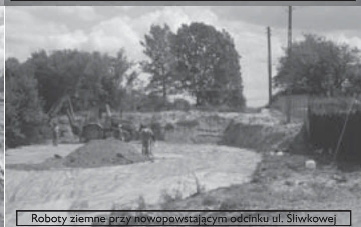
Roboty ziemne przy nowopowstającym odcinku ul. Śliwkowej